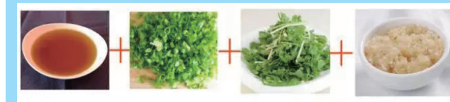
基础搭配 2: 花椒油 + 葱花 + 香菜 + 蒜泥

由于气候和人文等条件,饮食习惯不同造成的南北差异化近年来引起不少争论。作为大众接受度最高的美食之一的火锅,自然是少不了争议的。那么,火锅调料呢?