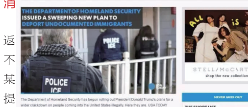
The Department of Homeland Security has begun rolling out President Donald Trump's plan for a wider crackdown on people coming into the United States illegally. Here they are. USA TODAY NETWORK

Alan Chiu, USA TODAY | Published 10:27 a.m. ET Feb. 21, 2017 | Updated at release time