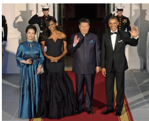
原第一夫人米歇尔·奥巴马身着 Vera Wang 访问中国 (慈爱的习大大和美美的国母)

Vera Wang 出身于纽约上东区的富裕家庭。从小学习花样滑冰的她，差一点就进了美国国家队。在 Vera Wang 决心踏入时尚界之后，她成为了 Vogue 杂志年龄最小的编辑，一做就是 17 年。40 岁的时候，她从新东家 Ralph Lauren 辞职，开创了自己的婚纱帝国。