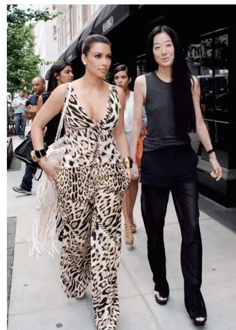
金·卡戴珊女士，三次婚礼都坚持要穿 Vera Wang

虽然每一套 Vera Wang 都价值不菲（高定系列高达 7000 美金），但哪个女孩子会不希望身穿最美的婚纱嫁给她此生挚爱呢？